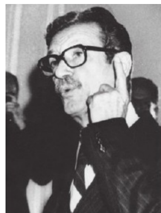
شاپور بختيار: منافع مشترکی مابین افکار من و دولت عراق وجود دارد.

دکتر بهشتی در پاسخ به این سؤال که «باتوجه به دخالت بختیار در کودتای شوم اخیر آیا احتمال قطع رابطه با فرانسه می رود؟» اظهار کرد: «به هرحال دادگاه بختیار را غیباً مورد محاکمه قرار می دهد و رأی خود را صادر می کند و پس از صدور رأی، به تقاضای دادگاه، موضوع استرداد بختیار مطرح می شود و اصولاً پس از محاکمات اخیر که تمام دلایل وقوع جرم او مشخص تر شد، بعداً دادگاه در این زمینه نظر خواهد داد.» (۱)